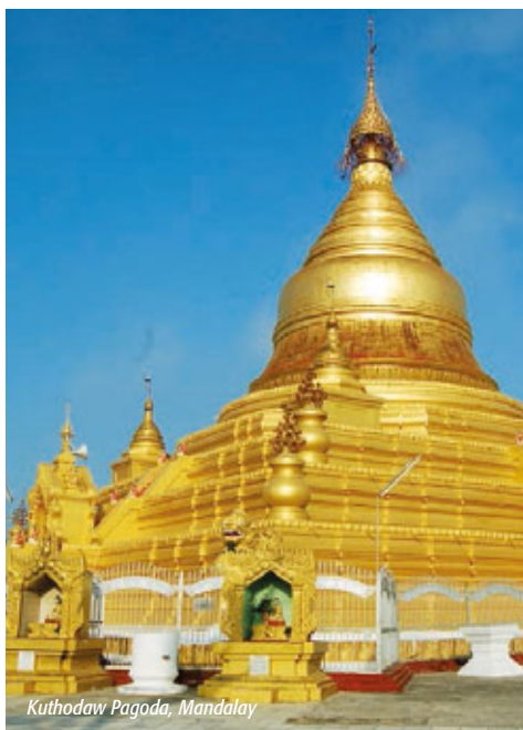
Kuthodaw Pagoda, Mandalay