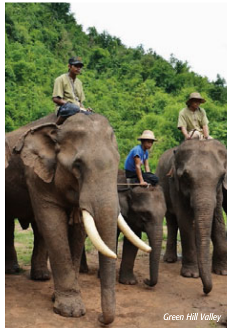
Green Hill Valley